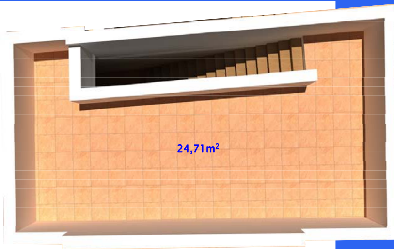
NIVEL 3 Vivienda Patio